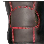
HAIX® FP System